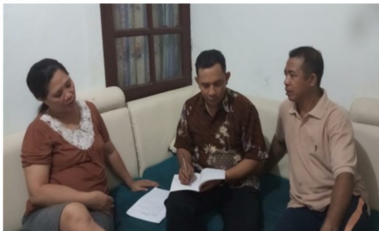
Gambar 1. Wawancara Kepada Orang Tua

Hal ini sejalan dengan pandangan bahwa keluarga merupakan lingkungan pertama yang menentukan keberhasilan pendidikan moral anak (Lickona, 2012).