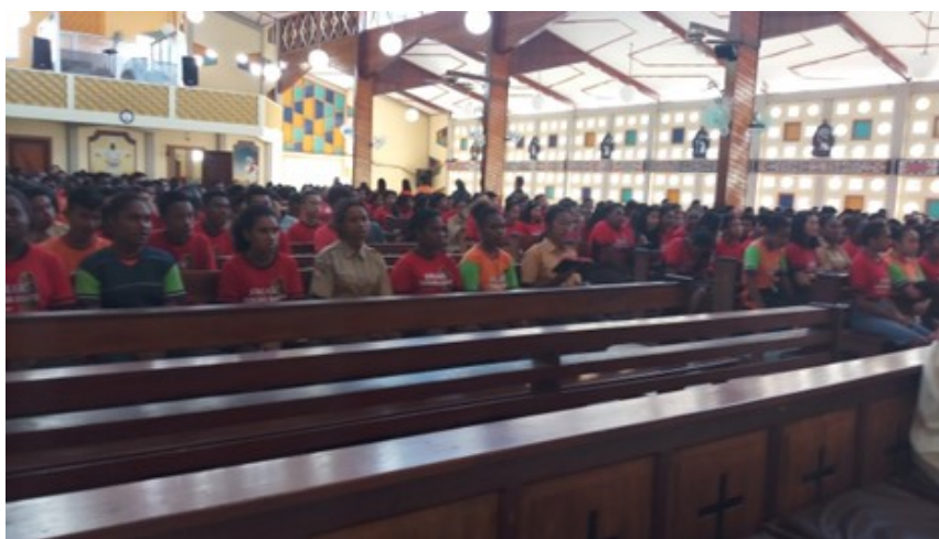
Gambar 2. Pembinaan Siswa Lewat Misa

Sekolah berperan sebagai lembaga formal yang mengembangkan dan memperkuat nilai-nilai religius melalui kegiatan pembelajaran dan program pembinaan karakter. Hasil penelitian menunjukkan bahwa sekolah telah mengintegrasikan nilai religius dalam kegiatan rutin seperti doa bersama, kegiatan keagamaan, serta pembinaan spiritual. Guru juga berperan sebagai teladan dalam membentuk karakter siswa (Ari et al., 2024; Aris et al., 2020; Nadziroh et al., 2023). Namun, dalam praktiknya masih ditemukan adanya kesenjangan antara nilai yang diajarkan dan perilaku siswa, yang menunjukkan bahwa internalisasi nilai belum sepenuhnya berhasil.